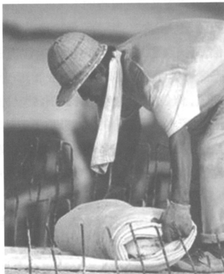
工人浇灌混凝土后,铺上厚厚的塑料布