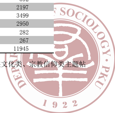
表 1-1 日常生活类主题帖分类

进一步统计显示，日常生活类、婚恋讨论类、饮食习惯类、民族文化类、宗教信仰类主题帖可细分为如下类型（见表 1-1、表 1-2、表 1-3、表 1-4、表 1-5）：